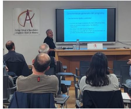
15 de Maig – Curs IEE