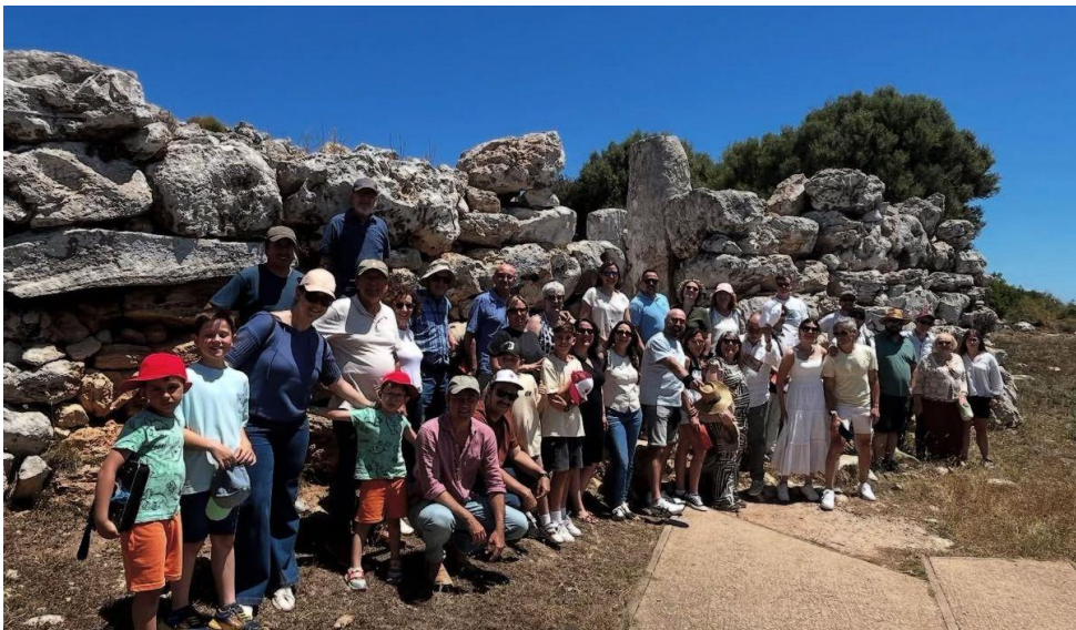
31 de Maig – Dia del Col·legiat a Torre d'en Galmés i dinar a Lluçalsdent Gran