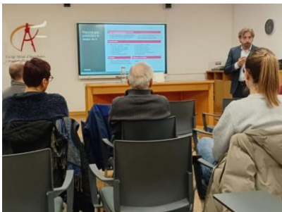
25 de Novembre – Xerrada AT i MUSAAT