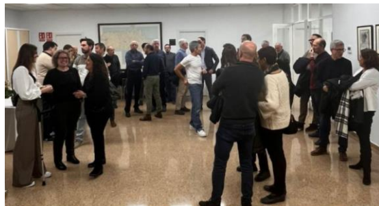
13 de Desembre – Acte presentació COATMe