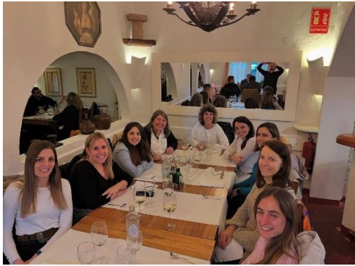
14 de Març – Primer dinar de col·legiades, 8M